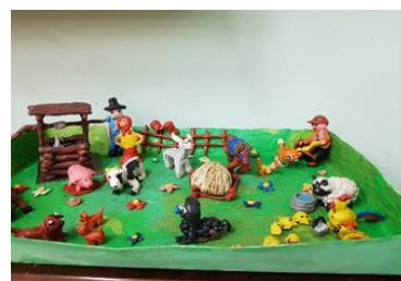
В. Белов «Рассказы о всякой живности»