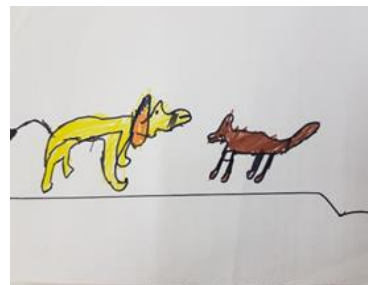
«Лев и Собачка» Л. Толстой